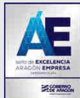
Categoría Plata: > ACF INNOVE > ATADES > COLEGIO CRISTO REY > INGENNUS