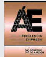
Categoría Bronce: > BODEGAS SAN ALEJANDRO > BOPEPOR > CÁMARA DE HUESCA > CENTRO DE FP CORONA DE ARAGÓN > COLEGIO ESCOLAPIAS DE BARBASTRO > COLEGIO MARIANISTAS > COLEGIO MARISTAS > FUNDACIÓN AGUSTÍN SERRATE > NODRIZA TECH